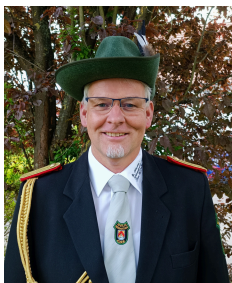
Euer 1. Vorsitzender

Hisst die Fahnen, nehmt an den Festzügen teil und lasst uns gemeinsam in Alme Schützenfest feiern. Wir freuen uns auf Euch.