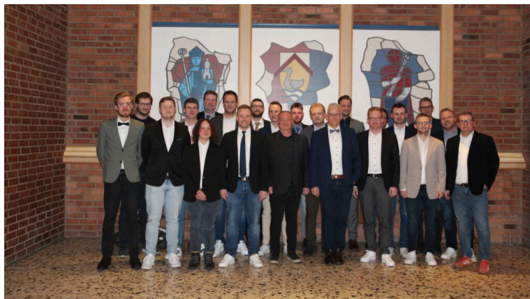
Der aktuelle Vorstand

Für die passende musikalische Gestaltung der Versammlung sorgten in gewohnt guter Weise die Jungmusiker des Musikvereins Alme.